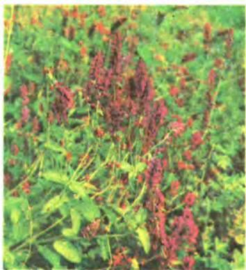
156. Буквиця лікарська.